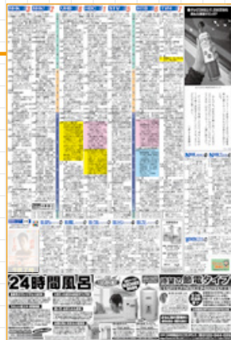
〈通常のテレビ面〉例①