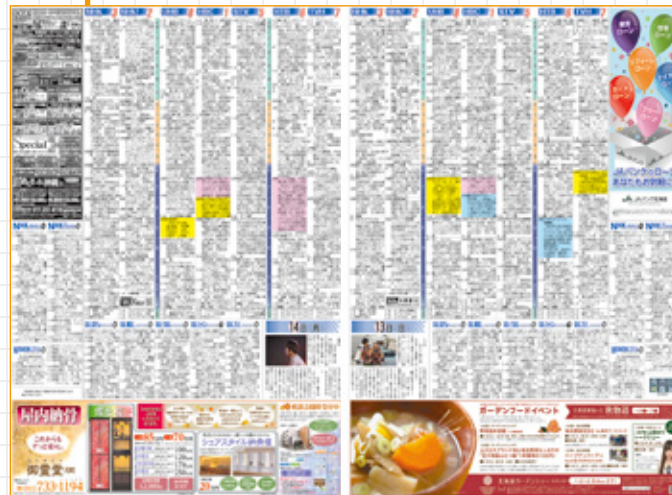
翌日(休刊日)のテレビ面