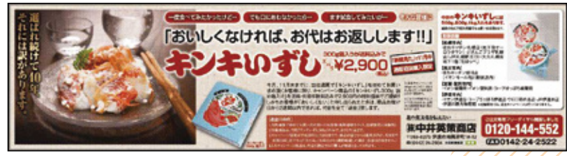
2016年11月10日 夕刊 全道版 全3段

夕刊フロント面に広告を掲載した、2016年の11月と広告を掲載しなかった2015年の11月を比較すると 売上げが25%アップ