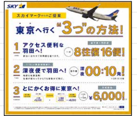
スカイマーク (半5段)