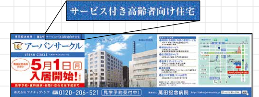
サービス付き高齢者向け住宅 萬田記念病院 (全3段)