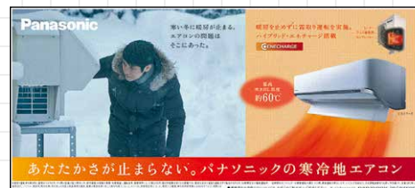
パナソニック (全5段)