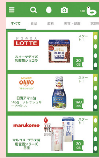
「CASHb」アプリトップページ (冬キャンペーン時)

普段のお買物で楽しみながらポイントを貯め、お小遣いにしている“節約上手さん”が急増しています! バーコードのないサービス・飲食などはレシートのみでOKですので、店舗誘客・客単価アップの販促ツールとしても有効です。 本社営業局 営業本部 営業推進部 千成珍