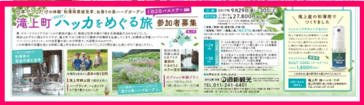
2017年8月22日(火)付 滝上町 (全3段枠)