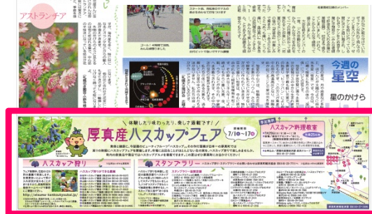
2017年6月27日(火)付 厚真町 (全3段枠)