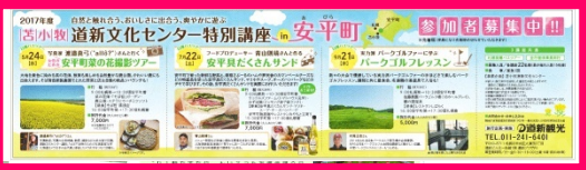
2017年4月4日(火)付 安平町 (全3段枠)