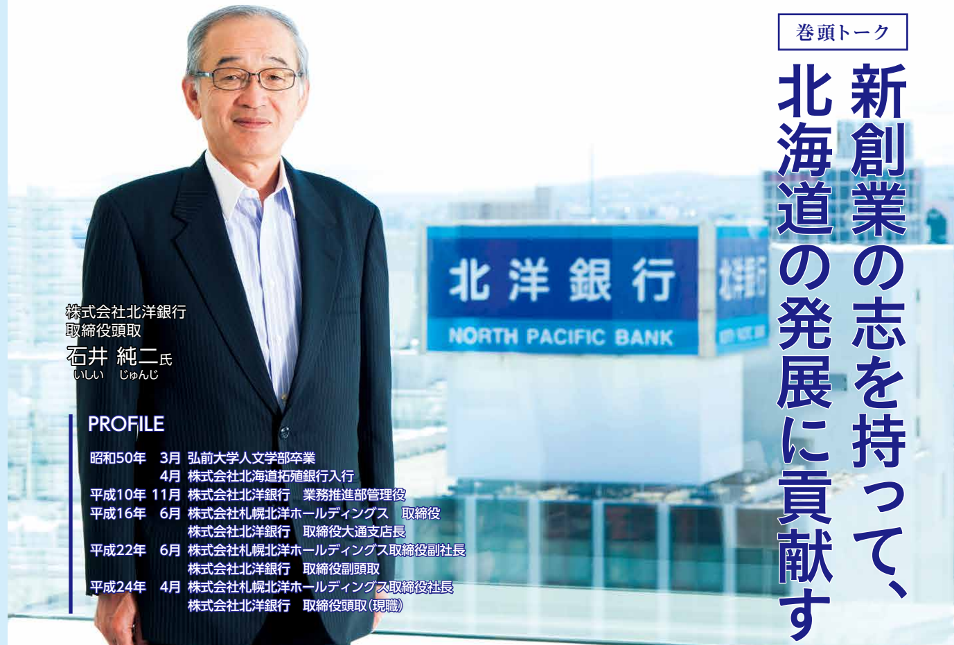
株式会社北洋銀行 取締役頭取 石井 純二氏 いしい じゅんじ