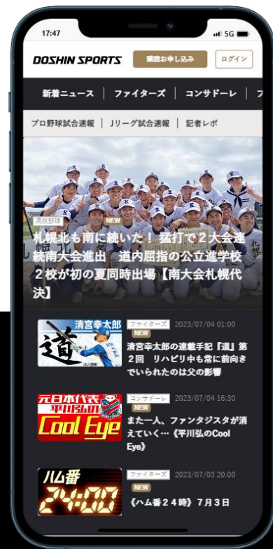
サイトTOPイメージ (SP表示)