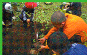
▲コンサドールから子供たちへ、その次の世代へ森づくりの願いは受け継がれていくことでしょ