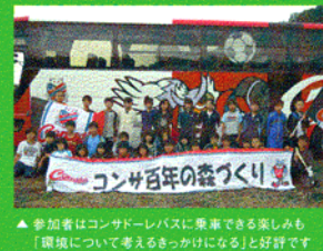
▲参加者はコンサドールバスに乗車できる楽しみも「環境について考えるきっかけになる」と好評です

小学校の児童を対象に「森の教室」を開催するなど、未来を担う子どもたちにも環境への思いを伝えつつ、今年中に計8,000本の植樹を目標としています。環境への思いは、もちろんコンサドール札幌のメンバーも同じ。ご覧のとおり、選手たちも堂々のエコ宣言!さらに26日(日)のFC岐阜戦では「道新サンクスマッチ」北海道エコ・アクションDAYとして、ラッキープレゼントや限定メニュー販売など楽しい企画もご用意しています。皆さんの大きなご声援とエコ・アクションの第一歩を、札幌厚別公園競技場でお待ちしています!