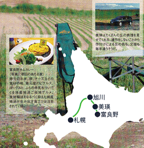
美瑛はたくさんの丘の表情を見せてくれる。道作らないことから作りかけの丘の色も、又様も毎年違うようだ。