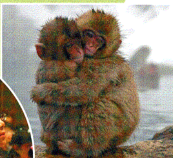
「ライフ」の 迫力ある動物の 映像に みんなくぎ付け!