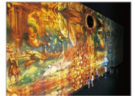
Instagramに投稿して温泉へ宿泊券を当てよう！