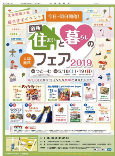
(↑2019年5月18日 朝刊 札幌本社版 全15段)