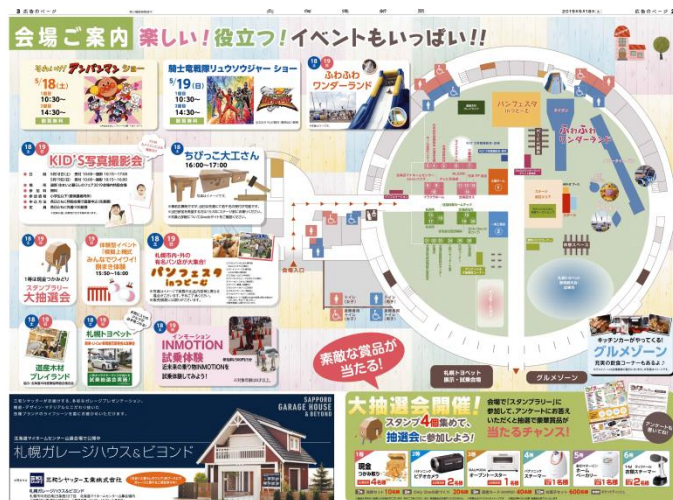
(↑2019年5月18日 朝刊別刷 4頁より抜粋)