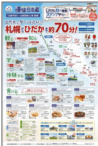
2018年7月27日 朝刊別刷「GURURI道の駅」全道版タブロイド全面 広告主：優駿日高道!!オールひだか魅力発信キャンペーン町実行委員会 広告会社：北日本広告社

◆お問い合わせ/北海道新聞社営業局 (TEL011-210-5713) へ (2018.8)