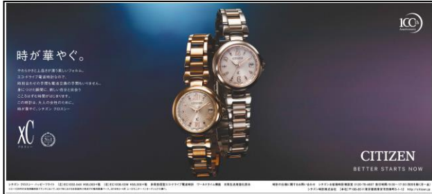
2018年7月13日 朝刊 全道版 全5段 広告主：シチズン (xC クロスシー) 広告会社：電通