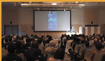
資産運用フェア特別講演