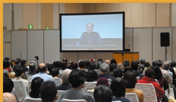
終活フェア特別講演