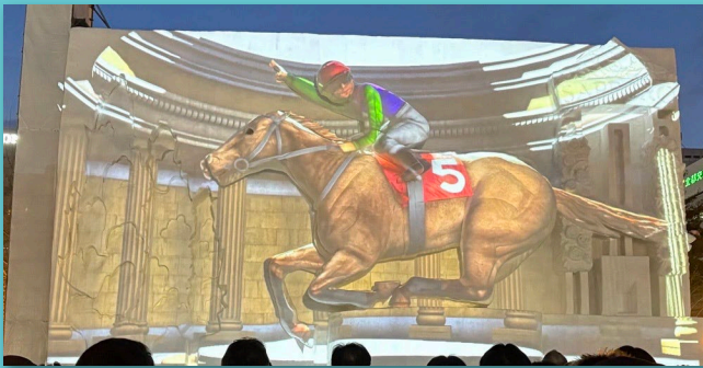
大雪像「栄冠に輝くサラブレッド」プロジェクションマッピング

さらにステージでは、サンプリングやPRイベント、クイズ大会、ゆるキャライベントなどを開催し、終日活気あふれる会場となりました。