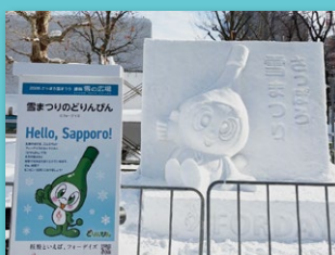
小雪像「雪まつりのどりんぴん」